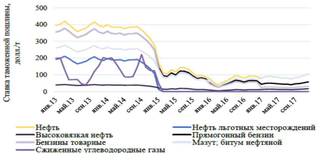
Рисунок 11 – Ставки таможенной пошлины на нефть и некоторые виды нефтепродуктов [55]

Если рисунок является авторской разработкой, составленным на основании внешних источников, необходимо перед заголовком указать на основании каких источников составлен рисунок , например .... Источник: составлено автором на основе данных [58]. (пример № 2).