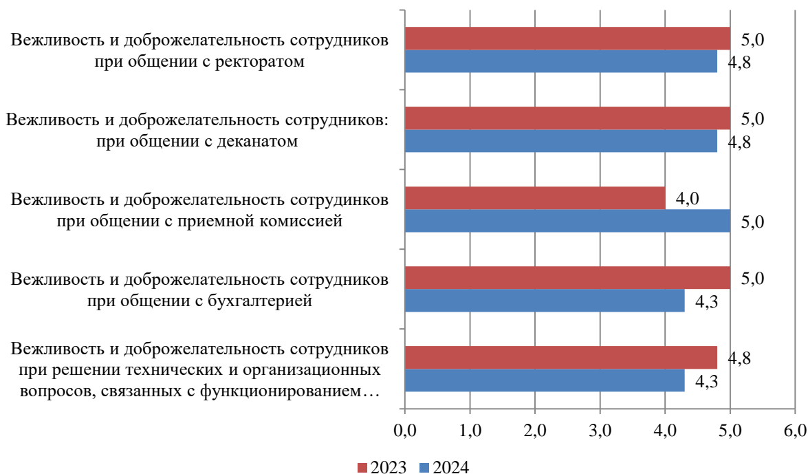
Рисунок Б.27 – Оценка студентами вежливости и доброжелательности сотрудников Института, балл

Результаты оценки вежливости и доброжелательности сотрудников Института представлены на рис. Б.27.