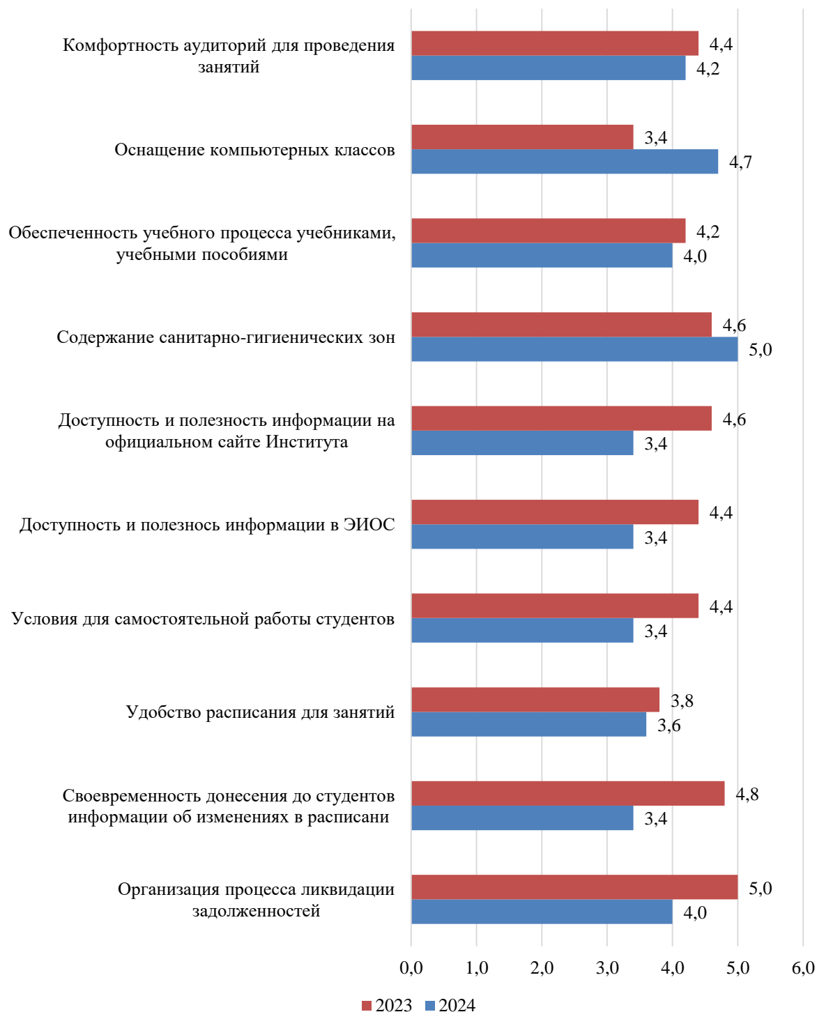
Рисунок Б.26 – Оценка студентами условий, созданных для обучения, балл

Результаты оценки условий, созданных для обучения, представлены на рисунке Б.26.