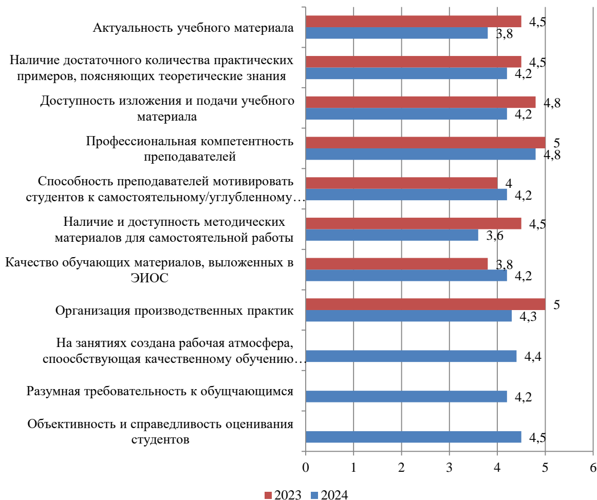
Рисунок Б.29 – Оценка студентами процесса обучения в Институте, балл

Результаты оценки процесса обучения в Институте представлены на рис. Б.29.