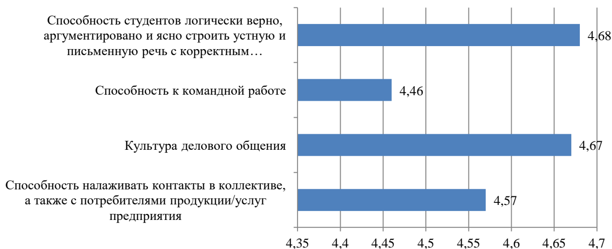
Рисунок Б.6 – Оценка респондентов на вопрос «Насколько Вы удовлетворены коммуникативными качествами студентов?», балл Оценка работодателей в отношении исполнительности и дисциплины студентов представлена на рис. Б.7.

Оценка работодателей в отношении коммуникативных навыков студентов представлена на рис. Б.6.