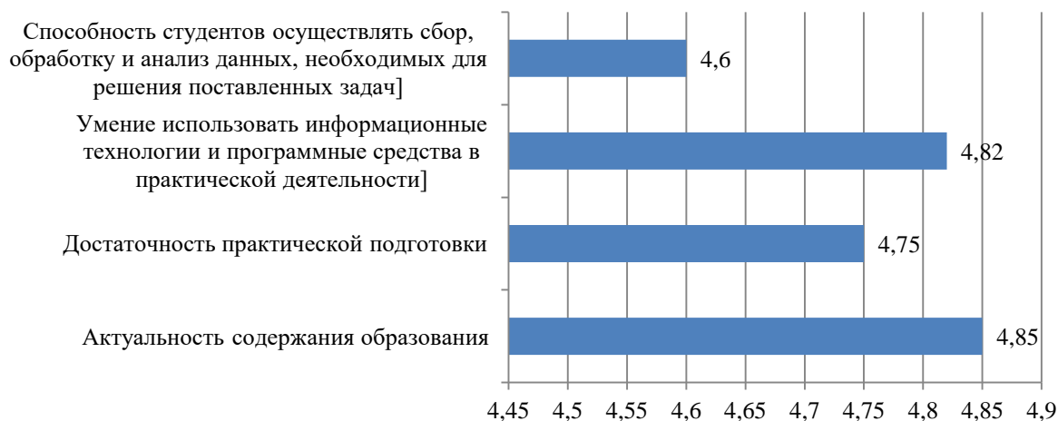
Рисунок Б.5 – Оценка респондентов на вопрос «Насколько Вы удовлетворены уровнем подготовки студентов в рамках реализуемой образовательной программы?», балл

Оценка работодателей в отношении уровня подготовки студентов в рамках реализуемой образовательной программы представлена на рис. Б.5.