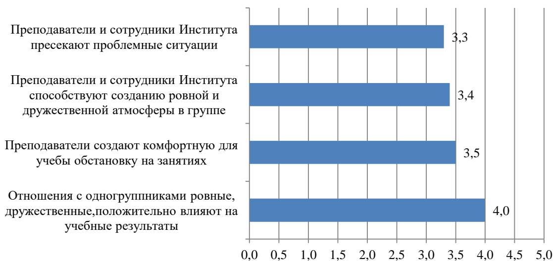
Рисунок А.38 – Оценка обучающимися коммуникаций в учебном процессе, балл

Оценка обучающимися коммуникаций в учебном процессе представлена на рис. А.38.