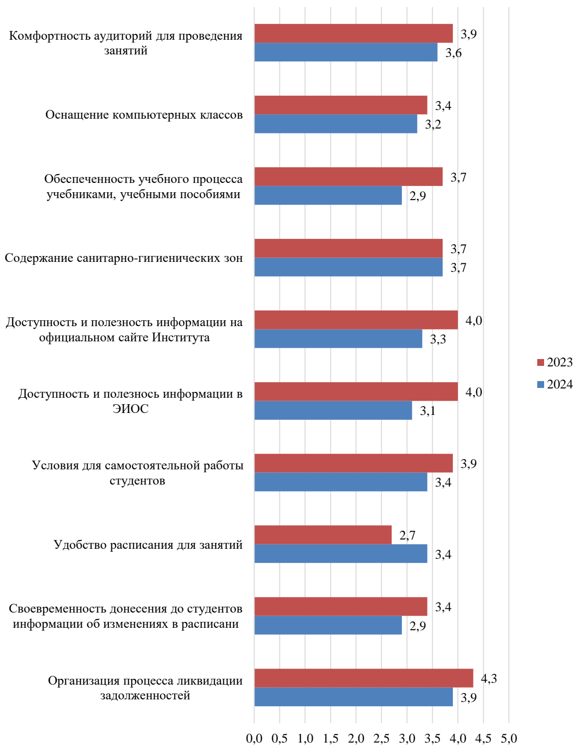
Рисунок А.36 – Оценка студентами условий, созданных для обучения, балл

Результаты оценки условий, созданных для обучения, представлены на рис. А.36.