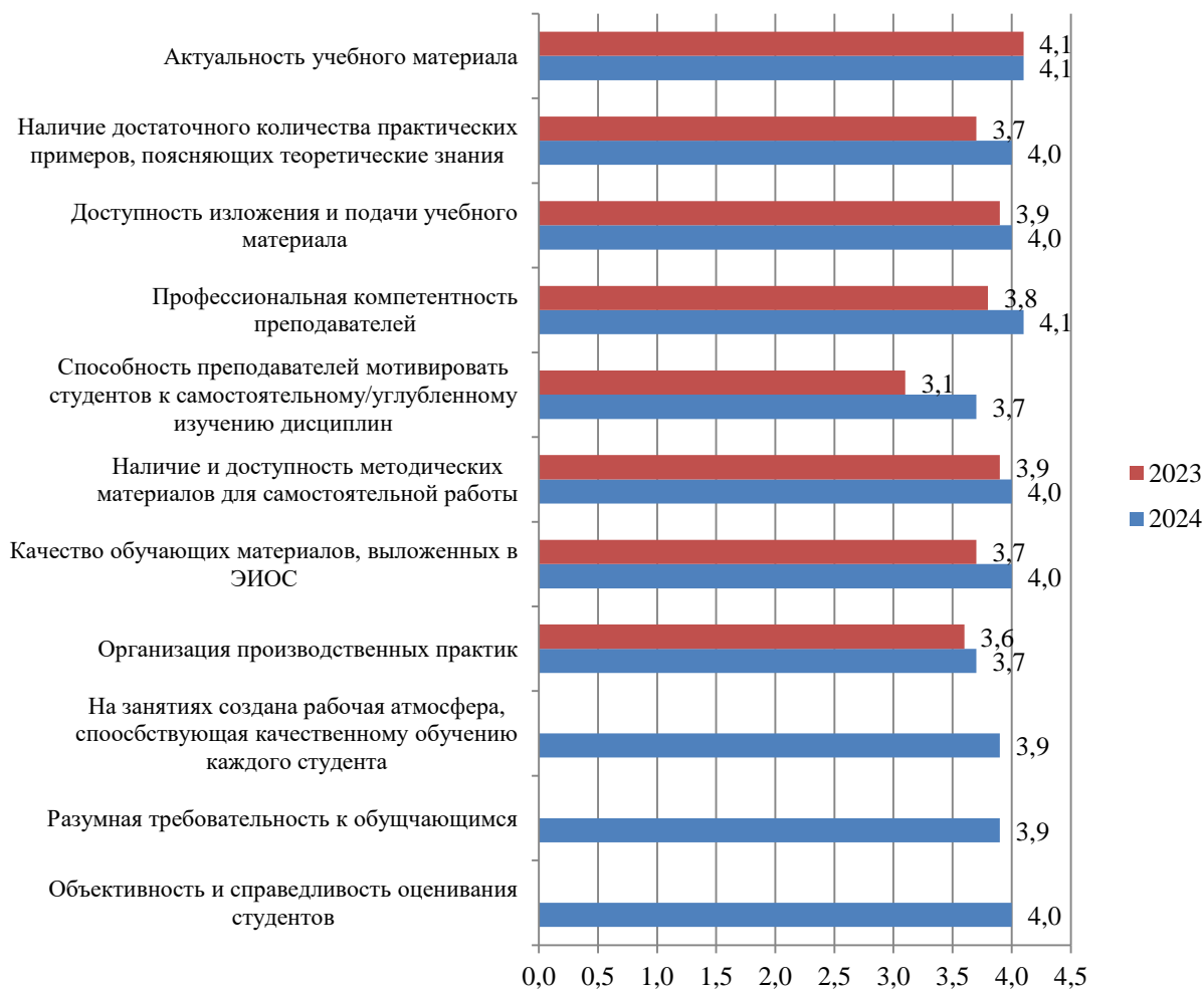
Рисунок А.39 – Оценка студентами процесса обучения в Институте, балл

Результаты оценки процесса обучения в Институте представлены на рис. А.39.