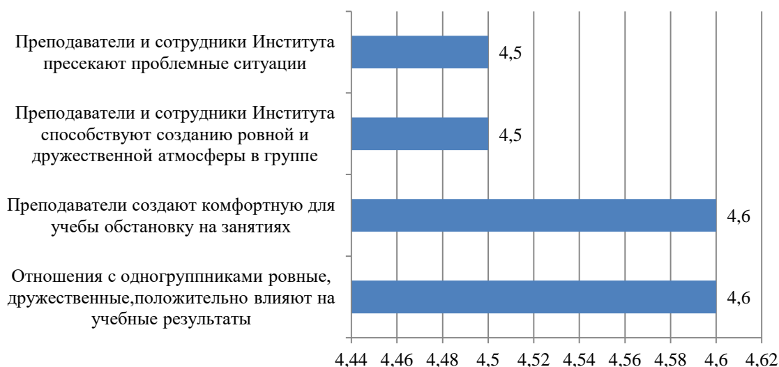
Рисунок Б.8 – Оценка обучающимися коммуникаций в учебном процессе, балл

Оценка обучающимися коммуникаций в учебном процессе представлена на рис. Б.8.