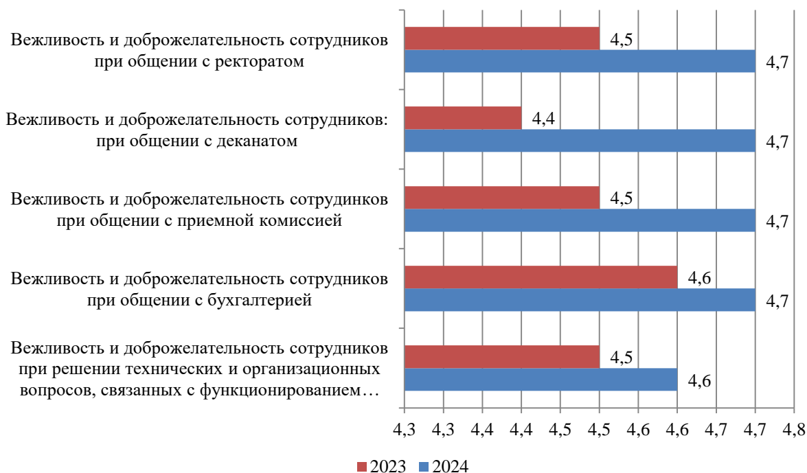
Рисунок Б.7 – Оценка студентами вежливости и доброжелательности сотрудников Института, балл

Результаты оценки вежливости и доброжелательности сотрудников Института представлены на рис. Б.7.